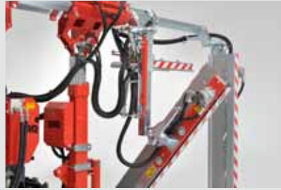
Anfahrssicherung waagerechter und senkrechter Schneidbalken über Gasfeder mit selbsttätiger Rückstellung