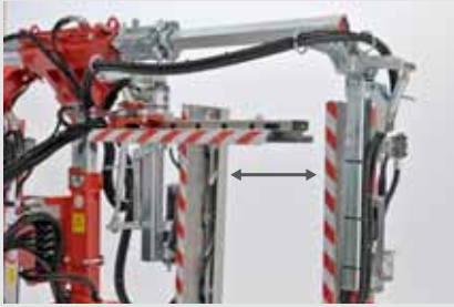
Manuelle Schnittbreitenverstellung (15 cm - 85 cm)