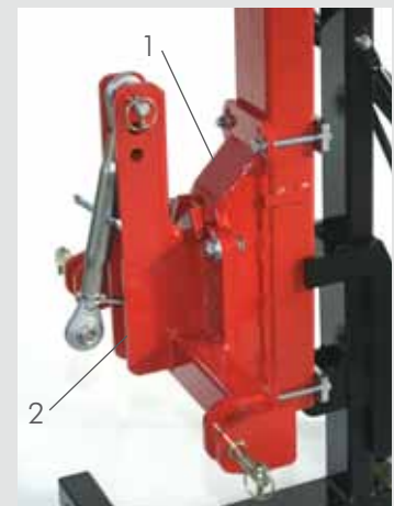
1 - Aufnahme für Hubrahmen starr. 2 - Dreipunkt Kat. I (Option)