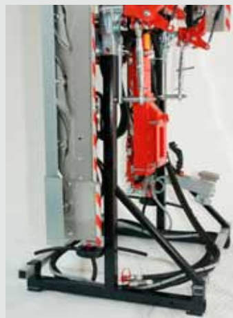
Abstellfuß (nur bei ELITE zweiseitig L Komfort und ELITE Überzeilen zweiseitig Komfort)