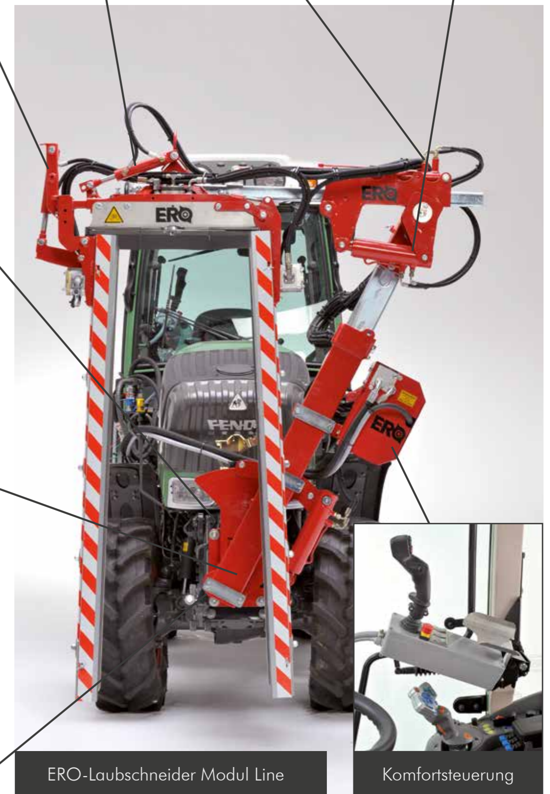
ERO-Laubschneider Modul Line