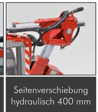
Seitenverschiebung hydraulisch 400 mm