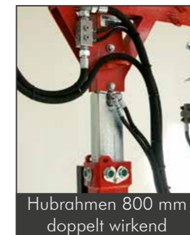
Hubrahmen 800 mm doppelt wirkend