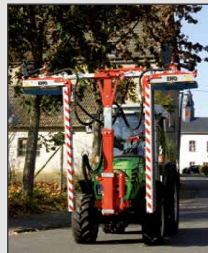
ERO-Laubschneider Modul Line zweiseitig L-Form