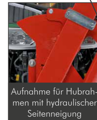
Aufnahme für Hubrahmen mit hydraulischer Seitenneigung