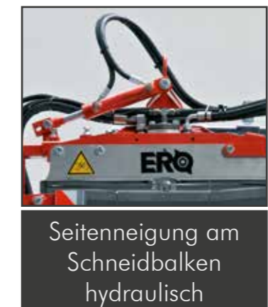
Seitenneigung am Schneidbalken hydraulisch