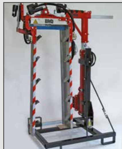
ERO-Laubschneider Modul Line einseitig Überzeilen auf Abstellvorrichtung (Option) mit hydraulischer Höhenver- stellung