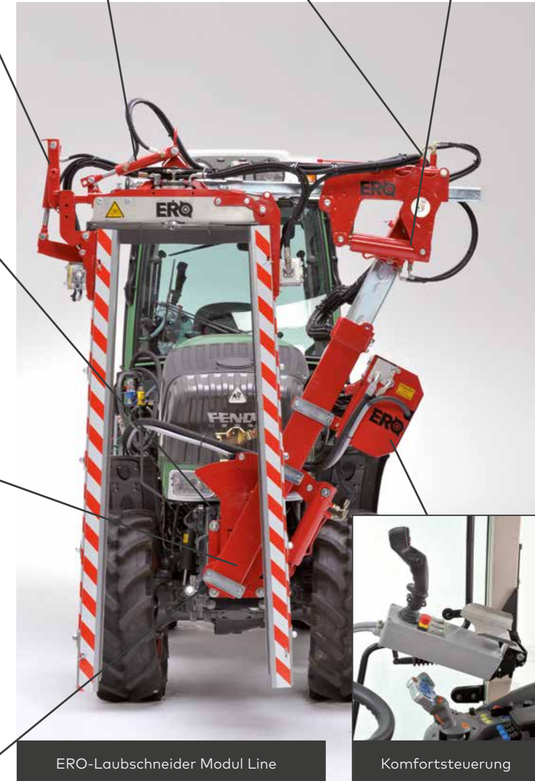
ERO-Laubschneider Modul Line