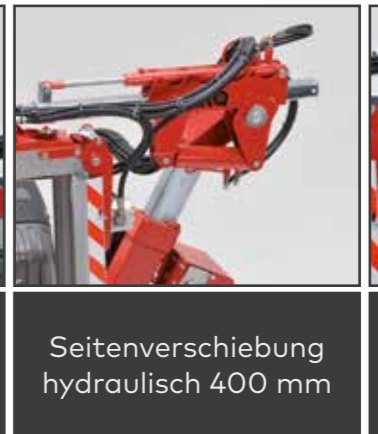
Seitenverschiebung hydraulisch 400 mm