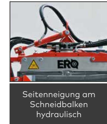
Seitenneigung am Schneidbalken hydraulisch