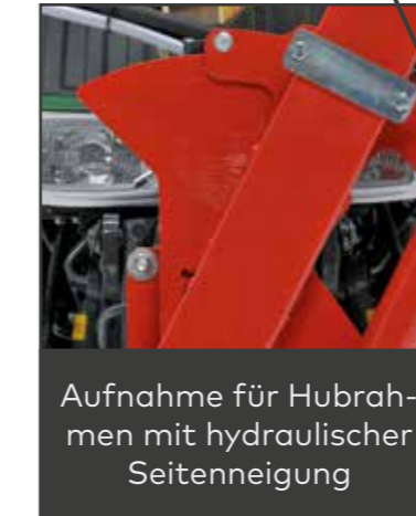
Aufnahme für Hubrahmen mit hydraulischer Seitenneigung